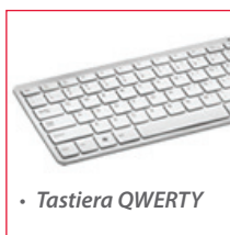
• Tastiera QWERTY