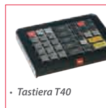
• Tastiera T40