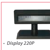
• Display 220P